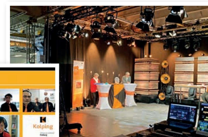
Impression aus dem Studio in Emmendingen

Einen ausführlichen Bericht über die Diözesanversammlung sowie die Wahlergebnisse zum neuen Diözesanvorstand findet ihr unter www.kolping-freiburg.de/