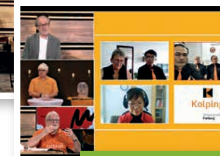
Live-Schaltung zu Kolping Vietnam