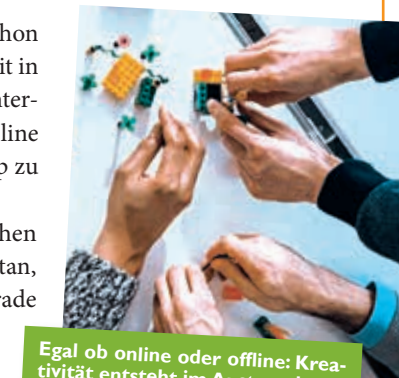
Egal ob online oder offline: Kreativität entsteht im Austausch mit anderen.