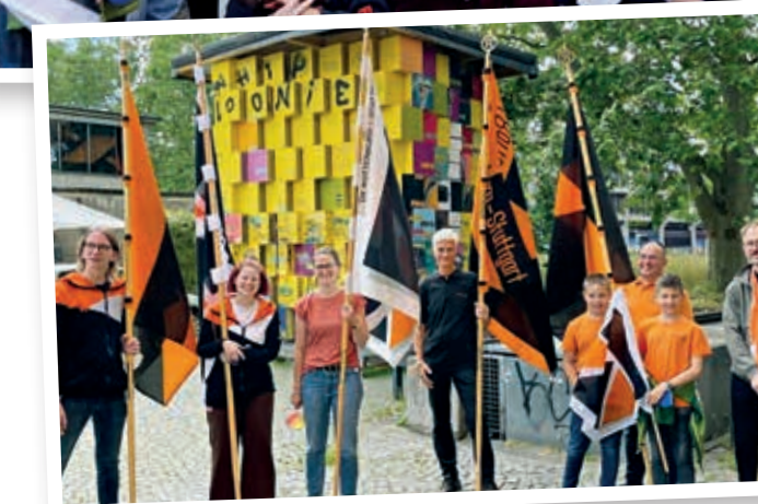
Kolping-Vielfalt auf dem Katholikentag in Stuttgart