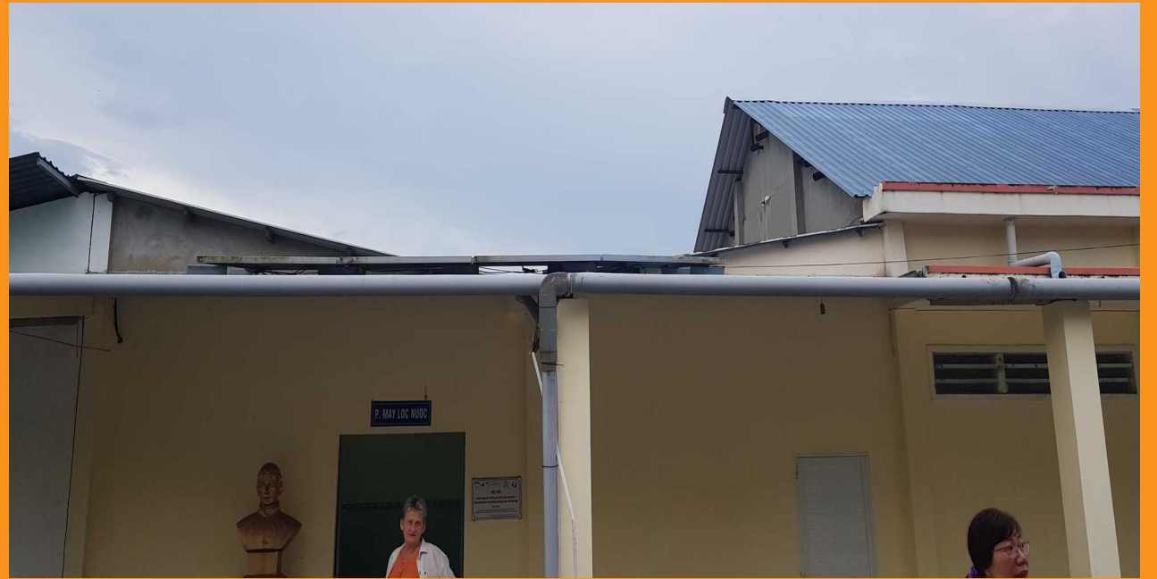
Bild oben - Solaranlage und Sammelfläche für das Regenwasser

Bild links - unter dem Mosaik befindet sich der Wassertank